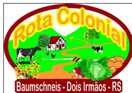
Figura 5 - Marca da Rota Colonial Baumschneis

Formatar um produto com essas características exige uma série de atividades preliminares para colocá-lo à disposição do público e foi isso que ocorreu nesse roteiro turístico. Verificou-se que, ao longo de um período de dois anos, antes da implantação oficial da Rota Colonial, nos anos de 1998 e 1999, foram realizados estudos de viabilidade, os locais foram preparados e os proprietários capacitados para receber os turistas e desenvolver o turismo em Dois Irmãos. Nesse mesmo período foi criada a marca da Rota, apresentada na Figura 5. A mesma faz menção à zona rural de Dois Irmãos, caracterizando os atrativos do roteiro, representada por um caminho que tem em seu trajeto uma casa na técnica de construção enxaimel, árvores, verduras, alguns animais como vacas e galinhas e os dois morros que dão nome ao município de Dois Irmãos.